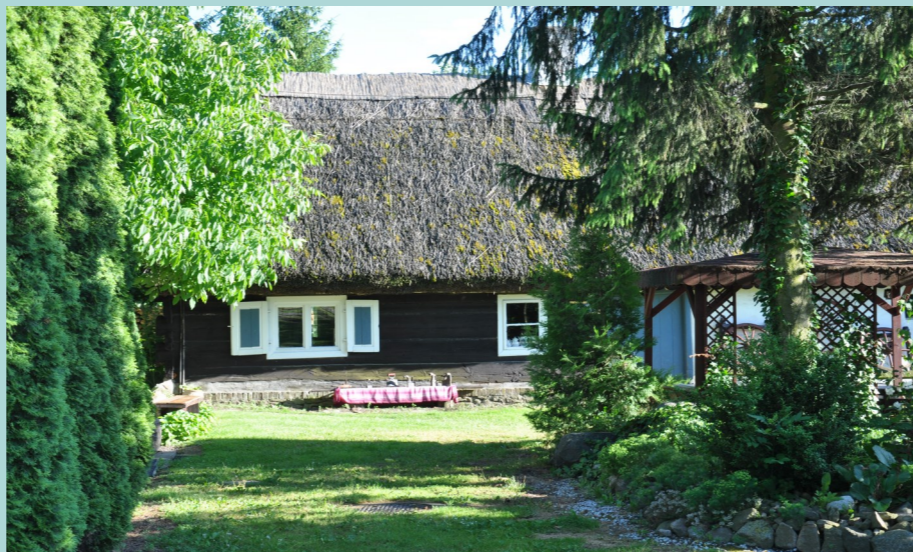
3. miejsce dla Piotra Lityńskiego za zdjęcie skansenu w Stanisławkach